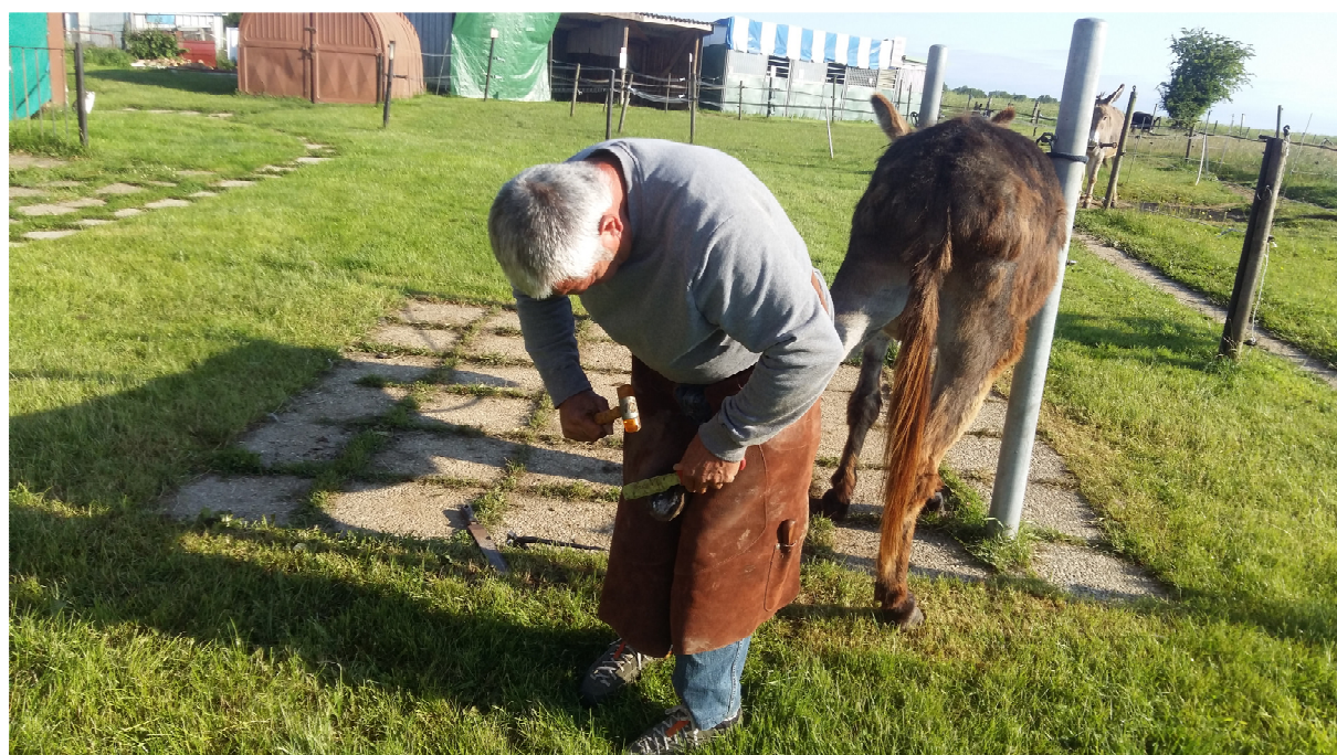
L'après-midi est consacrée à Ramsès, en solo, pour évacuer sa peur de la veille, (et pour qu'il tire un peu car 'Moosieu' laisse travailler sa sœur...), RAS, angoissé mais sa peur est passée, nous revérifierons demain.